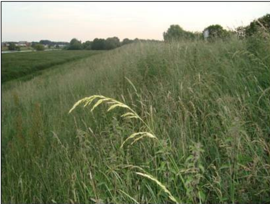
Zomer 2010, gras voor maaien