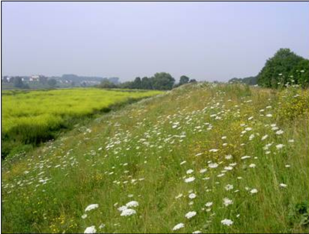
Zomer 2009, begraasd met schaapskudde